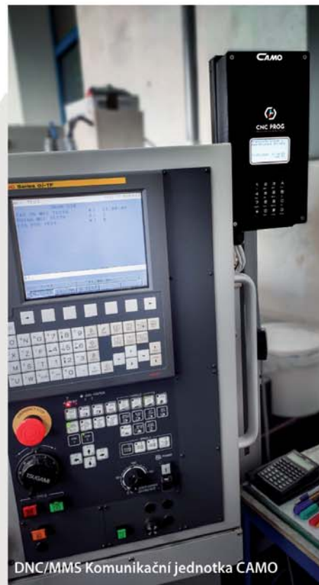
DNC/MMS Komunikační jednotka CAMO

Vzdělávali jsme se a drželi trend i v jiných oblastech, v počítačových sítích a instalacích serverů, v docházkových, zabezpečovacích a kamerových systémech, ve stravovacích systémech, v antivirové ochraně a zálohování dat, v oblasti osobních a skupinových tiskáren Kyocera.