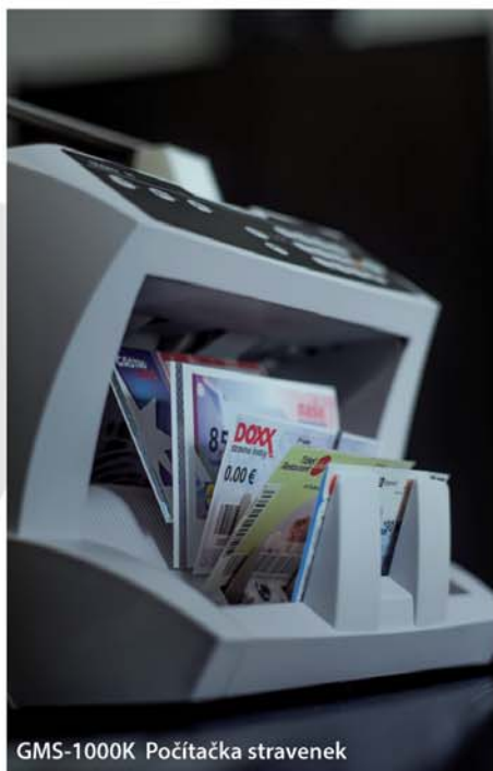
GMS-1000K Počítačka stravenek

V současné době jsou pro nás stěžejní zejména dvě oblasti. První oblastí je výroba a servis počítačů stravenek a poukázek s čárovými kódy a v podstatě celá oblast automatizace zpracování čárových kódů včetně vývoje vlastního software. Zpracováním čárových kódů se zabýváme 19 let a v posledních 10 letech jsme se stali lídrem na evropském trhu, a nejen evropském, v oblasti automatizace zpracování tiketů s čárovými kódy. Vyvíjíme, vyrábíme a u zákazníků instalujeme naše výrobky a náš software. Zákazníky máme v České republice,