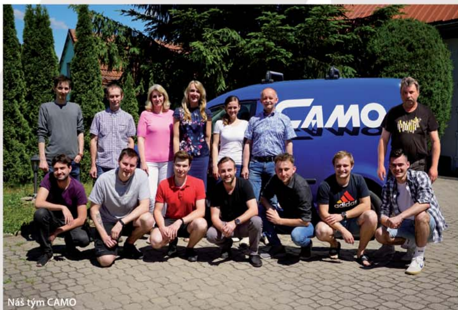
Náš tým CAMO

Klub úzce spolupracuje s městem Slavičín při pořádání kulturních a sportovních akcí v městském parku. Jsem nadšeným podporovatelem i aktivním hráčem kuželkářského sportu a největší odměnou by pro mě bylo, pokud by se nám společně s Městem Slavičín podařilo postavit 4-dráhovou kuželnu ve Slavičíně, aby nám mladí nadaní kuželkáři stále neodcházeli do Luhačovic nebo do Zlína a abychom ve Slavičíně hráli 3. nebo 2. kuželkářskou ligu.