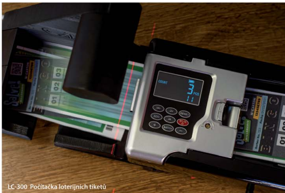
LC-300 Počítačka loterijních tiketů

Stále ale hledáme nové lidi do našeho týmu s inovativním myšlením, techniky, programátory. V lidech, kteří chtějí pra-