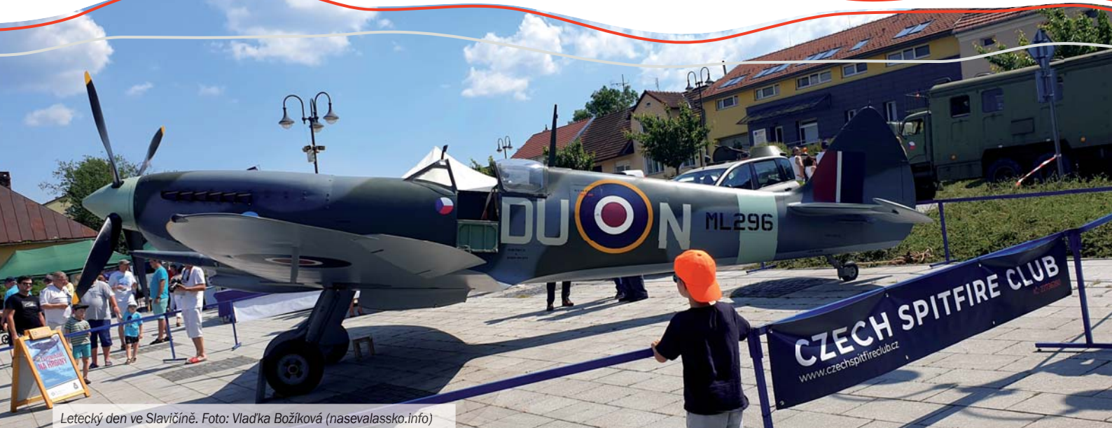
Letecký den ve Slavičíně.

Vážení a milí spoluobčané, dny, kdy vzniká tento úvodník, se pro mě nesou ve znamení Leteckého dne plukovníka Stehlíka i intenzivního vyjednávání o odškodnění za výbuch muničních skladů.